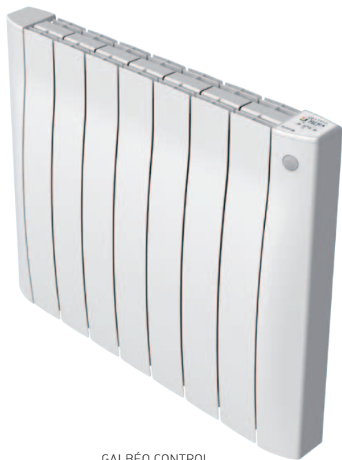
GALBÉO CONTROL EF 1000