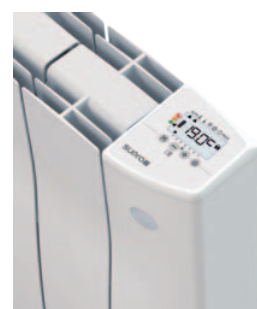
Détecteur de présence