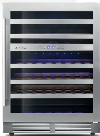
LB 468 INOX