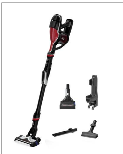
AIR FORCE FLEX 460 ANIMAL KIT