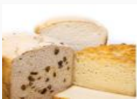
Pain sans gluten