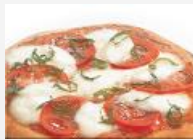
Mode pâte à pizza